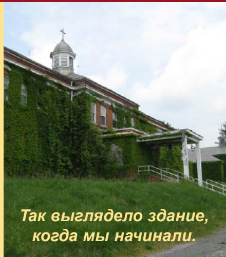
Так выглядело здание, когда мы начинали.