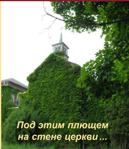
Под этим плющем на стене церкви ...