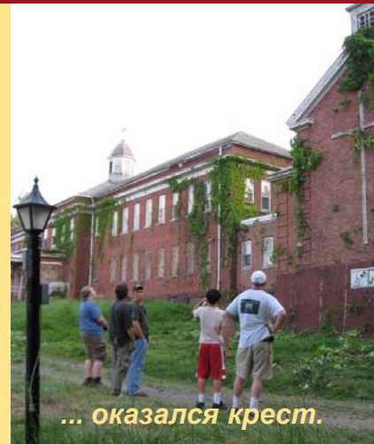
... оказался крест.

2781 State Route 145, Middleburgh, NY 12157